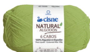
00255 VERDE NATURE