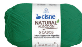
00229 VERDE BANDEIRA