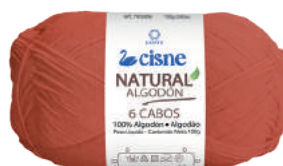
01098 LARANJA VIBRANTE