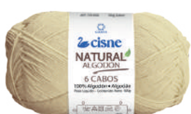
00292 AMARELO CANDY