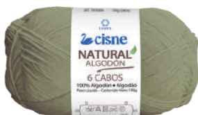
00214 VERDE OCRE