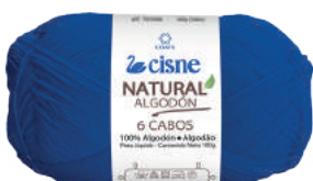
00142 AZUL ESCURO