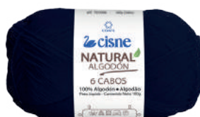
00152 AZUL MARINHO