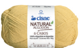
00298 AMARELO BABY