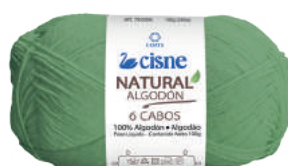
00242 VERDE GRAMA