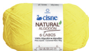
000270 AMARELO VIBRANTE