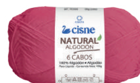
00063 ROSA PINK