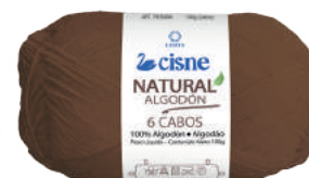
00361 MARROM ESCURO