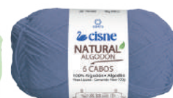
00144 AZUL SERENITY