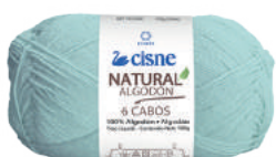
00167 VERDE ACQUA