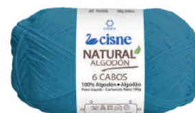
01076 AZUL PETRÓLEO