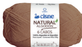
00373 MARROM TERRA