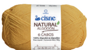
03302 AMARELO ESCURO