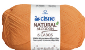
000324 LARANJA CLARO