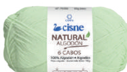
01043 VERDE CANDY