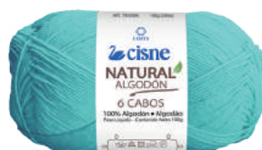
00186 VERDE TIFFANY