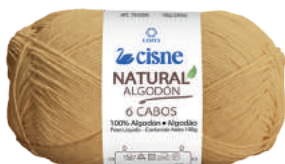
00891 AMARELO MEL