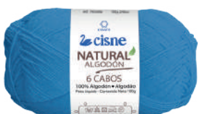
01089 AZUL TURQUESA